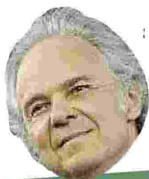
Pietro Salini Webuild

Ritaglio stampa ad uso esclusivo del destinatario, non riproducibile.