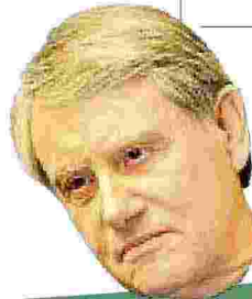
Gianluigi Aponte Msc

Ritaglio stampa ad uso esclusivo del destinatario, non riproducibile.