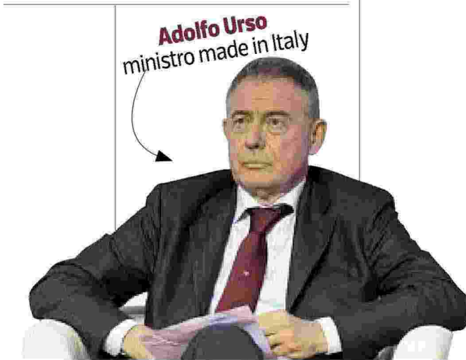
Adolfo Urso ministro made in Italy