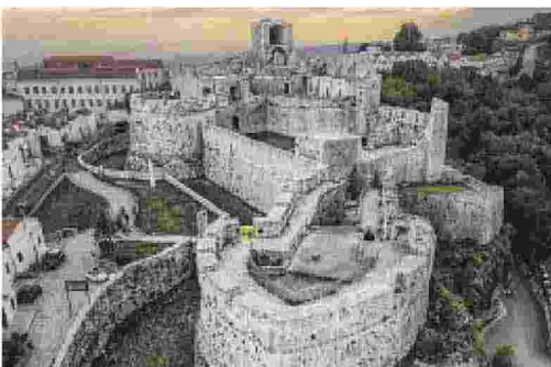
IL CASTELLO Monte Sant'Angelo

Gli arrangiamenti di Girotto e il genio teatrale di Peppe Servillo riescono tracciare un nuovo percorso, suggestivo e inaspettato, attraverso venti grandi canzoni di Battisti. Un percorso ricco di sapori latini, ritmi avvolgenti, storia, emozioni e grande pathos. Da Il mio canto libero a E penso a te , la maestria di uno dei più originali interpreti della canzone italiana e di cinque grandi musicisti di jazz si mette al servizio di questo straordinario autore, abbattendo i confini che separano il mondo della canzone da quello del jazz e dell'improvvisazione per portare il pubblico in un territorio aperto: quello della grande musica e della magia dei suoni.