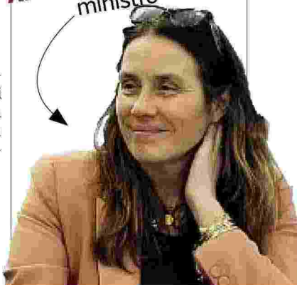
Alessandra Locatelli ministro

Su 2mila assunzioni Enel, di cui le prime 1.200 di professionisti dedicati alla rete già quest'anno, il 30% riguarderà Mezzogiorno continentale e Isole.