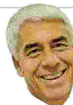
Stefano Consiglio Con il Sud

S alerno e Catanzaro sono le due uniche province del Sud su nove totali in Italia nelle quali si avvierà dal 2025 la sperimentazione del nuovo sistema dell'invalidità civile. Lo annuncia il ministro per le Disabilità Alessandra Locatelli.