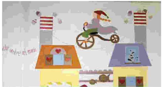
Un murales nel plesso della scuola Falcone