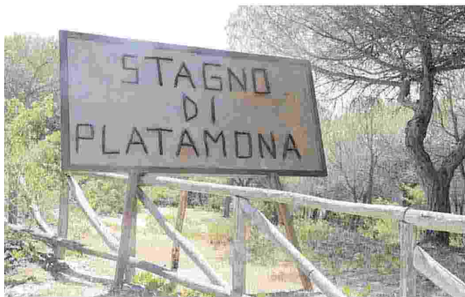
Segnaletica nello stagno di Platamona