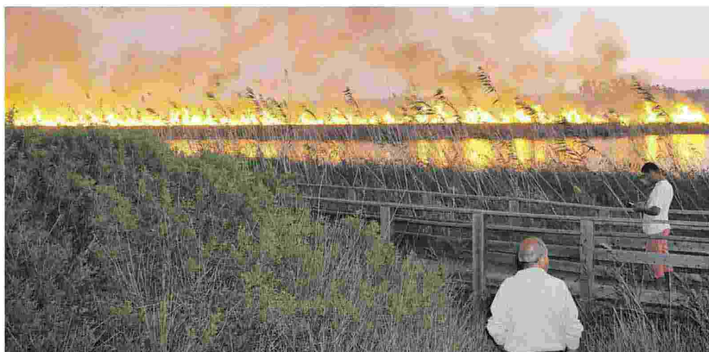
Il devastante incendio delle scorse settimane